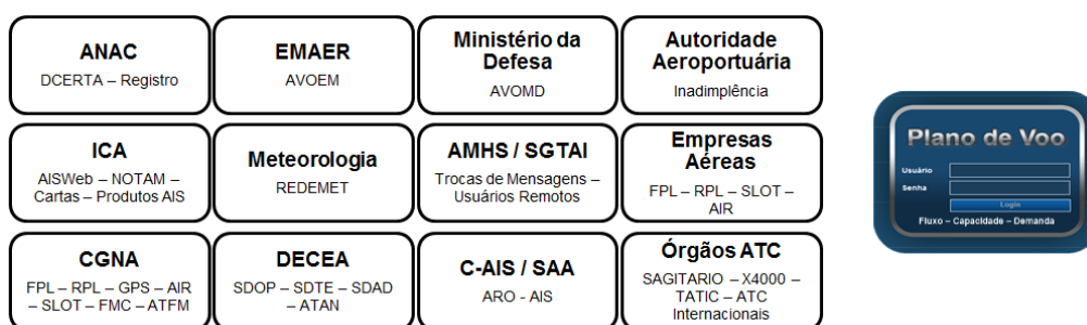
Figura 1. Necessidades de interoperabilidade entre bancos de dados

2.1.8 A falta de interoperabilidade no processo de entrega, recebimento, análise e encaminhamento das intenções de voo que ocorre durante o seu preenchimento não permite a melhor eficiência do processo, ou seja, a integração automatizada com todos os setores envolvidos, o que resulta na necessidade de intervenção humana para verificar a consistência das informações, conforme a figura abaixo: