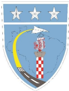
Destaque Controle do Espaço Aéreo Ouro