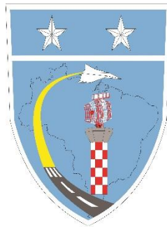
Destaque Controle do Espaço Aéreo Prata